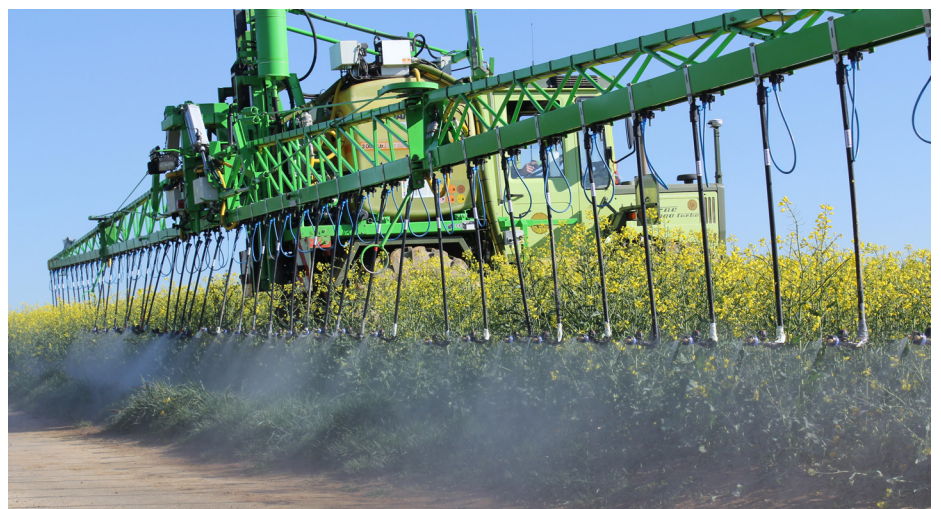
Abb. 10 - Die Darstellung zeigt ein Spritzbild mit Wasser.