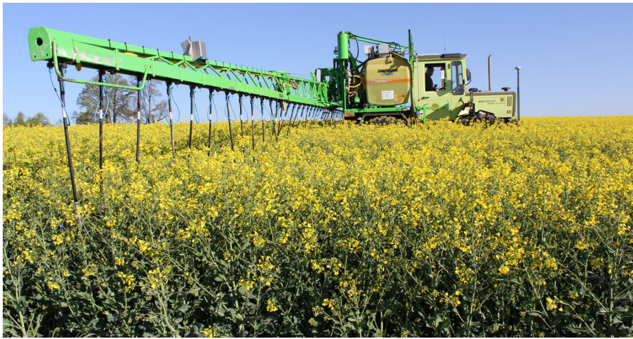
Abb. 08 - Bei der Durchfahrt mit abgesenkten Droplegs.

Düsen am Spritzgestänge anzubringen. Dies muss allerdings nur das erste Mal gemacht werden, da diese Einhängenvorrichtungen für die Droplegs anschließend am Gestänge verbleiben. Beim nächsten Einsatz geht dann alles viel schneller. Die Düsen werden eingehängt und mit einem Splint gesichert und der Versorgungsschlauch mit dem Bajonettverschluss am Düsensockel angebracht. Andere Fragen waren relativ schnell geklärt. Es kommt zu keinen Schäden an den Pflanzenbeständen und die auftretenden Kräfte werden selbst von 32 m Spritzgestängen problemlos abgefangen. Die Droplegs „mogeln“ sich aufgrund der Befestigungstechnik elegant durch den elastischen Pflanzenbestand. Lediglich beim Rückwärtsfahren muss darauf geachtet werden, die Düsen auszuheben.