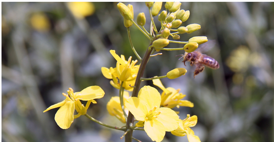
Abb. 06 - Bienen beim Blütenbesuch im Raps.

den Möglichkeiten und Grenzen dieser Technologie konnte von Jahr zu Jahr erweitert werden. Vor wenigen Wochen, im vergangenen Dezember hat das Julius Kühn-Institut (JKI) zu einem 2-tägigen Workshop eingeladen, bei dem der aktuelle Sachstand zusammengetragen und die noch offenen Fragen thematisiert wurden. Sämtliche Tagungsbeiträge können auf der Homepage des JKI eingesehen werden.