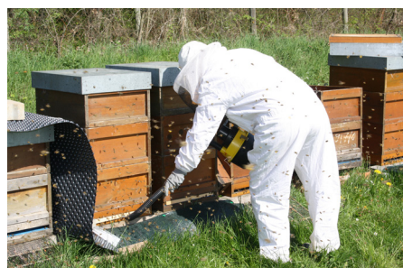
Abb. 05 - Absammeln von der Iracht zurückkehrender Bienen.

den Möglichkeiten und Grenzen dieser Technologie konnte von Jahr zu Jahr erweitert werden. Vor wenigen Wochen, im vergangenen Dezember hat das Julius Kühn-Institut (JKI) zu einem 2-tägigen Workshop eingeladen, bei dem der aktuelle Sachstand zusammengetragen und die noch offenen Fragen thematisiert wurden. Sämtliche Tagungsbeiträge können auf der Homepage des JKI eingesehen werden.