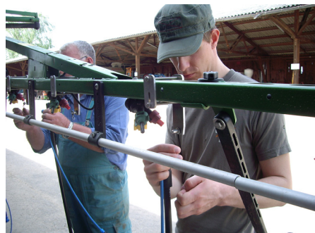
Abb. 03 - Befestigung der Halterungen der Droplegs.

(BMELV) finanziell unterstützten FitBee-Projektes wurde eine Applikationstechnik entwickelt, die diese negativen Risiken deutlich minimieren kann. Die sogenannten Droplegs UL (Fa. Lechler, Metzgingen), die unterhalb der Blütenebene des Rapses, also etwa 35 cm tief in den blühenden Bestand eintauchen, halten so den überwiegenden Teil der Blüten wirkstofffrei. ( siehe Abb. 02 u. Abb. 03 ). Seit 2011 wurde eine Vielzahl von Versuchen in den unterschiedlichsten Institutionen mit diesen Düsen durchgeführt und der Wissensumfang zu