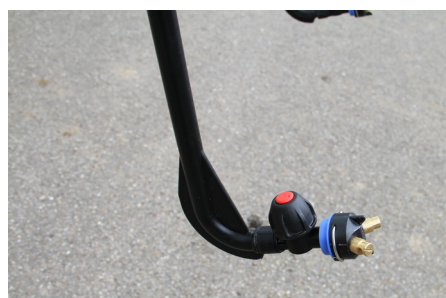
Abb. 04 - Flachstrahldüsen.