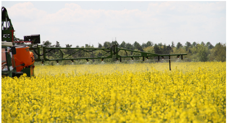
Abb. 01 - Konventionelle Applikation der Spritzmittel.

Die Wildbiene des Jahres 2013, die zweifarbige Schneckenhausbiene, braucht z.B. die leeren Schneckenhäuser der Schnirkelschnecken. Die Wildbiene 2015, die zweifarbige Zaunrüben-Sandbiene ist komplett abhängig vom Vorhandensein der Zaunrübe. Der hohe Grad der Spezialisierung macht es besonders den Solitärbiene