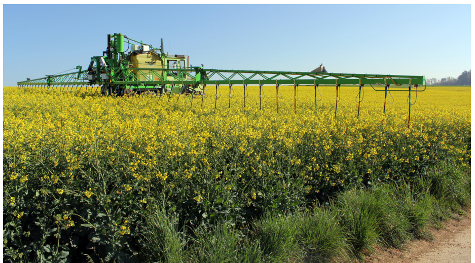
Abb. 02 - Droplegs in Aktion.

schwer, in den von Blütenarmut geprägten Regionen zu überleben. Sie fehlen dann später wieder als Bestäuber, so dass es auch für die von ihnen abhängigen Pflanzen schwierig wird. Dazu muss man auch wissen, dass diese kleineren Bienenarten nur einen sehr begrenzten Flugradius von wenigen hundert Metern haben, in dem sie sowohl den geeigneten Nistplatz, wie auch die richtige Blütenpflanze finden müssen.